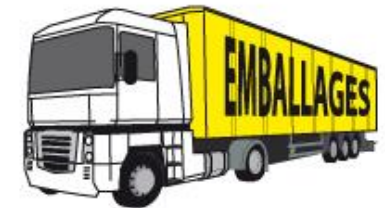
TRANSPORT JUSQU'AU CENTRE DE TRI