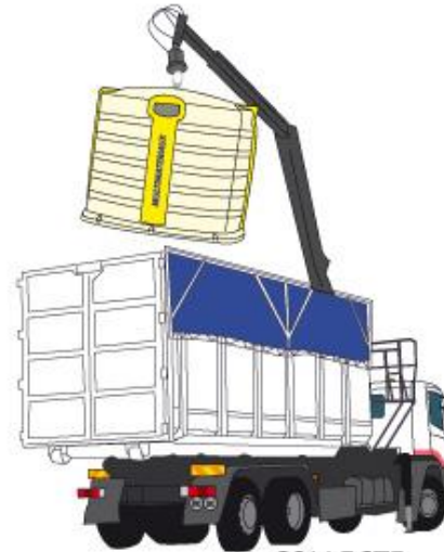
COLLECTE DES EMBALLAGES