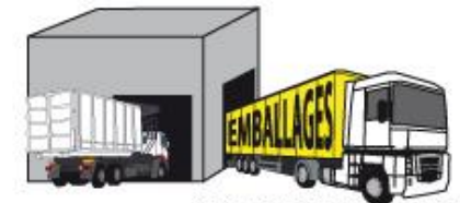
CENTRE DE TRANSFERT DE POULDREUZIC