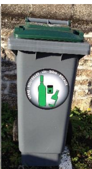
Bac verre 80l