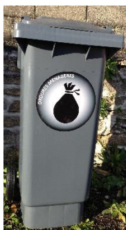
Bac OM 80l