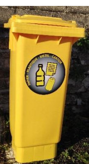
Bac jaune 80l