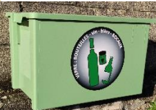
Caisse verre 60l